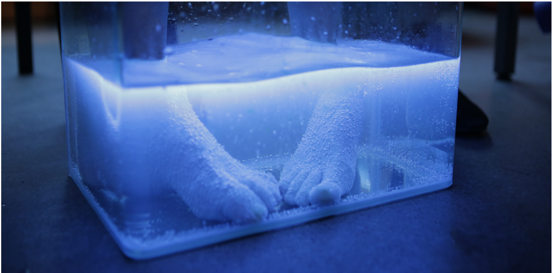
L'aquagymologie , photographie de la conférence-performance, École Nationale Supérieure d'architecture Paris-Vilette, 2014-2022

À travers la forme de la conférence-performance, le langage universitaire vient informer les corps sans gravité, en même temps que les abdo-fessiers infiltrent la posture du conférencier.