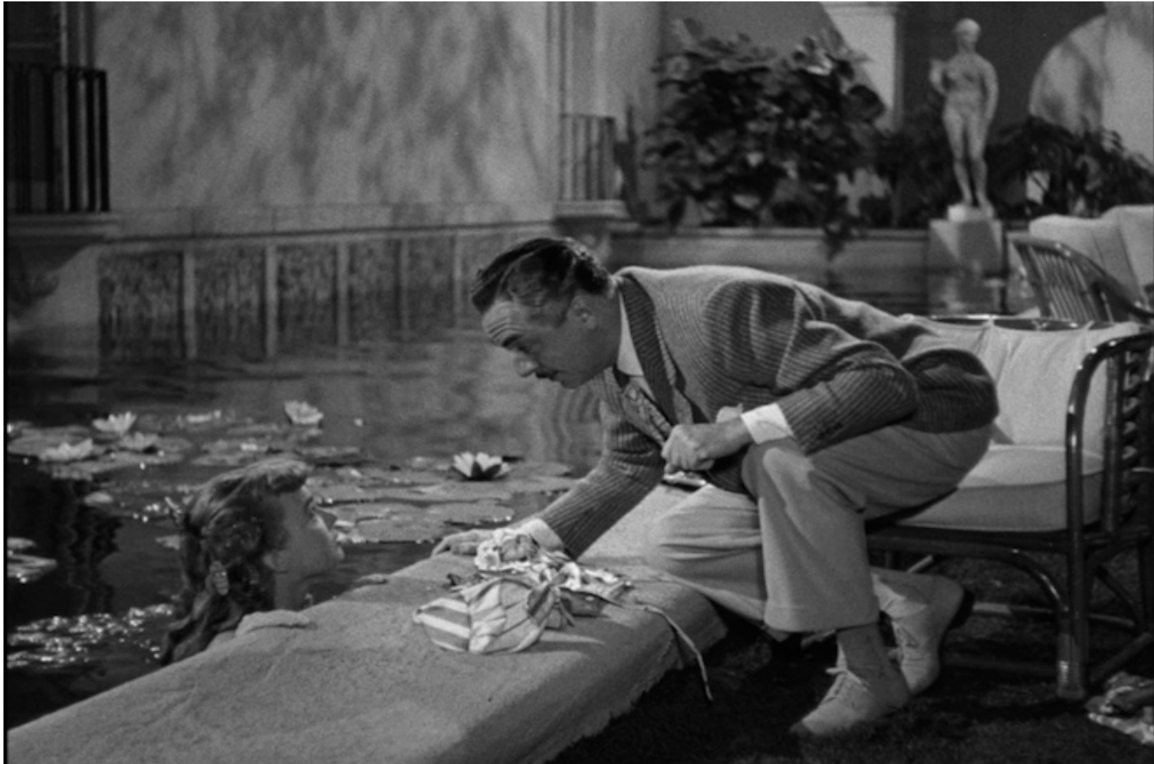
Monsieur pois et le roi , vidéo, dans le cadre de l'exposition personnelle «Mais où sont passés les tritons?», Galerie Olivier Meyer, 2017

Ils étaient souvent représentés chevauchant des dauphins ou des hippocampes et avec leurs conques marines ils personnifiaient le rugissement de la mer. Cette nouvelle génération de tritons, escortant les divinités marines pouvait être de sexe masculin ou féminin.