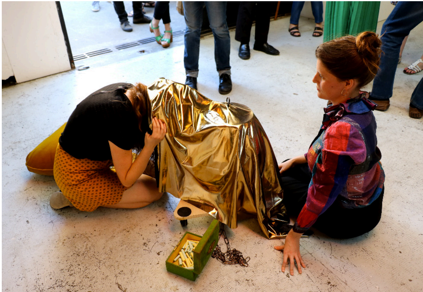
Le langage des oiseaux, performance, atelier Rotolux, 2016

Paradoxalement, on connaît l'expression « voix de perruche » qui signifie avoir une voix criarde mais aussi le verbe « perrucher » définissant péjorativement une femme bavarde voir prétentieuse (As-tu finit de perrucher ?).