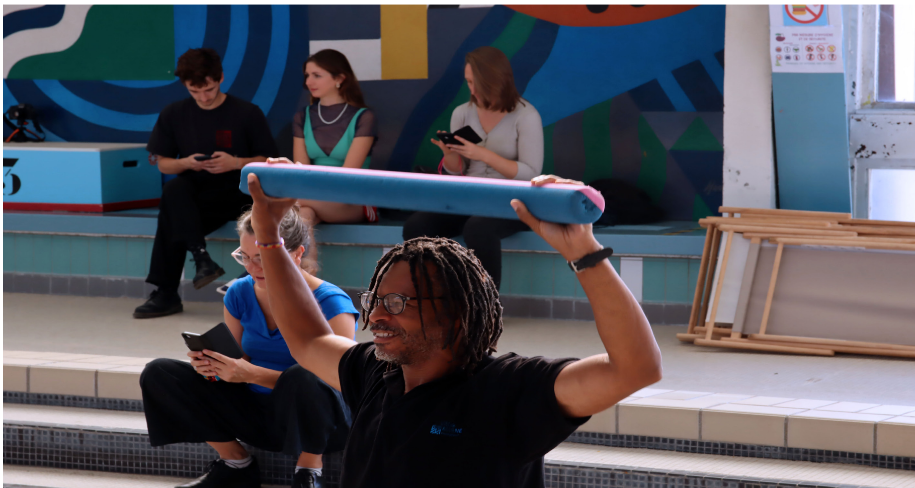
100% LYCRA, performance, photographie du TD, piscine municipale de Vitry-sur-Seine, 2018-2022

La coach session prend la forme d'un cours collectif composé d'exercices de tonification, de mouvements dansants aquatiques, de lectures sur planche en mousse. Les références théoriques mutent en outils pédagogiques (le périnée de Georg Friedrich Haendel, le chant de Joséphine la dauphine, les yeux d'Isabelle Adjani, la poussée d'Archimède) dans une mise en scène en écho avec celle de la piscine municipale (bonnet de bain à paillettes, maillot 100% lycra, frite bleu liquide, musique BOUMBOUM, drague autour du jacuzzi).