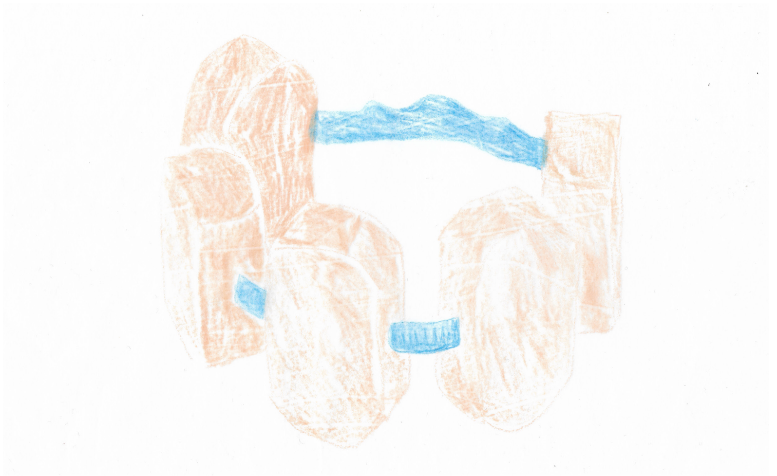
Objets flottants , série de dessins, crayons de couleur, 2021