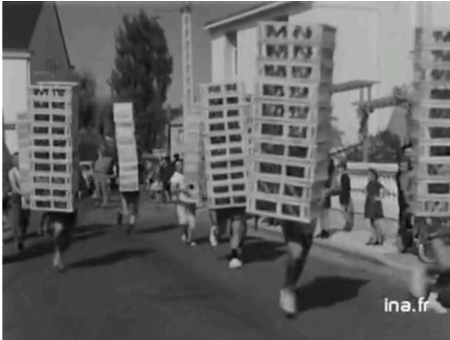
Jacques avec un s , performance dans le cadre de l'exposition Blackyard, collectif Open, it, 2019

Jacques avec un s ne ressemblait pas à un cageot, en 1958, il avait même participé à la marche des maraîchers nantais dite « course des cageots ». Jacques avec un s et son mini short avaient emprunté les ponts et remontés la rue Saint-Jacques pour finalement arriver à Saint-Jean.