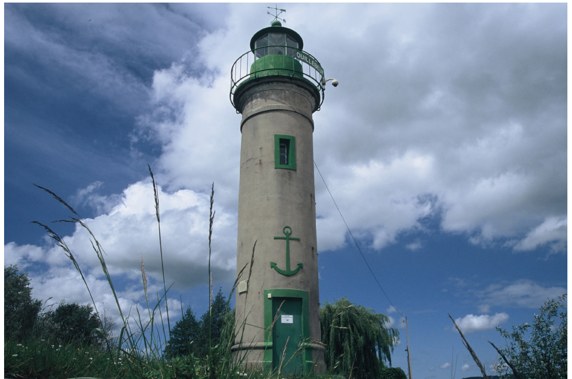
Larmes de sirènes , installation de pierres prélevées à l'entrée du détroit de Messine, 2017// Le chant des sirènes , installation sonore, geste performatif phare(s), 2017, dans le cadre de l'exposition personnelle : Mais où sont passés les tritons? , Galerie Olivier Meyer, Nantes, 2017