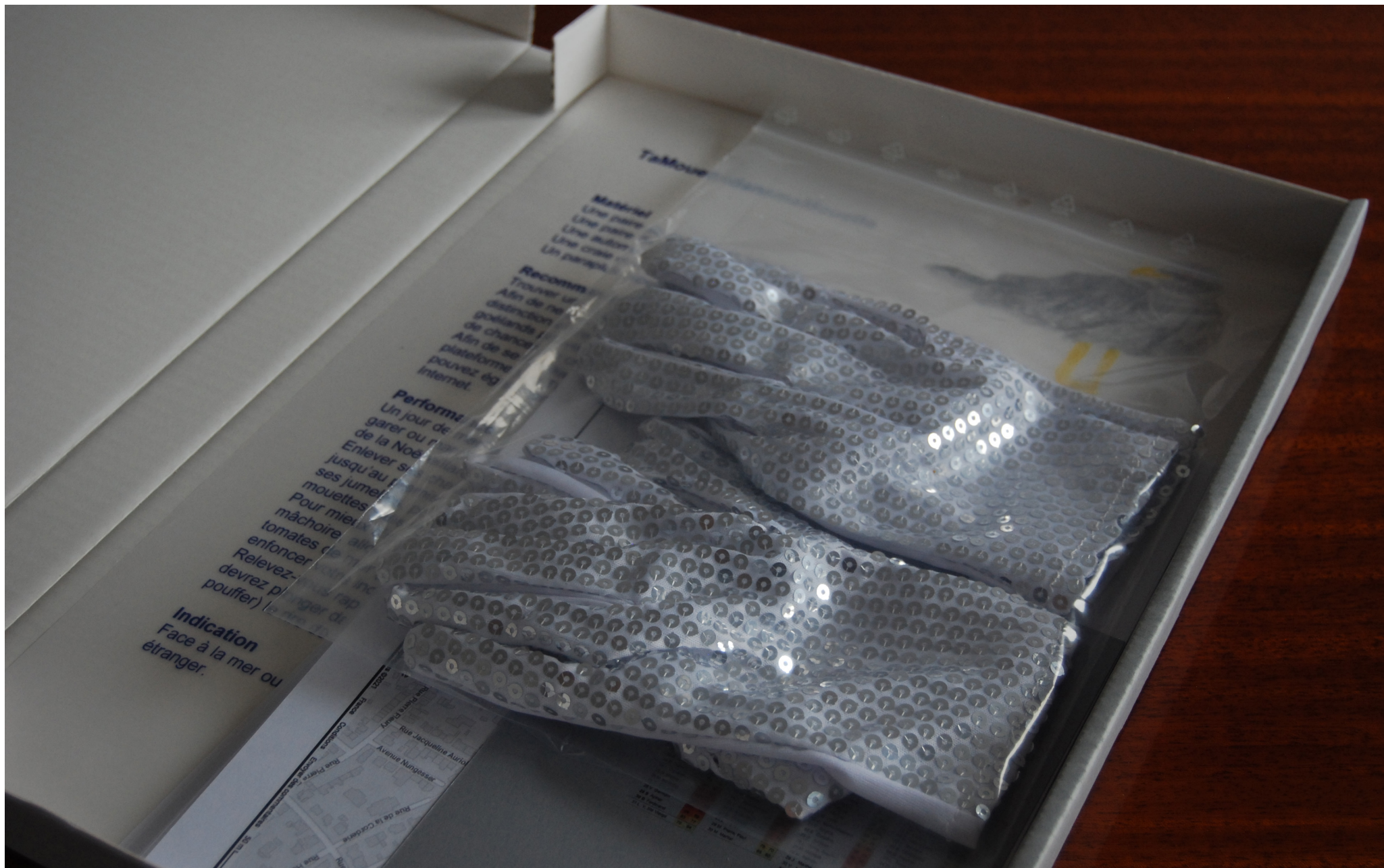
Tamouette dans ma Mouette , partition-performance, objet en kit, collection de l'artothèque de la ville de Strasbourg, 2021