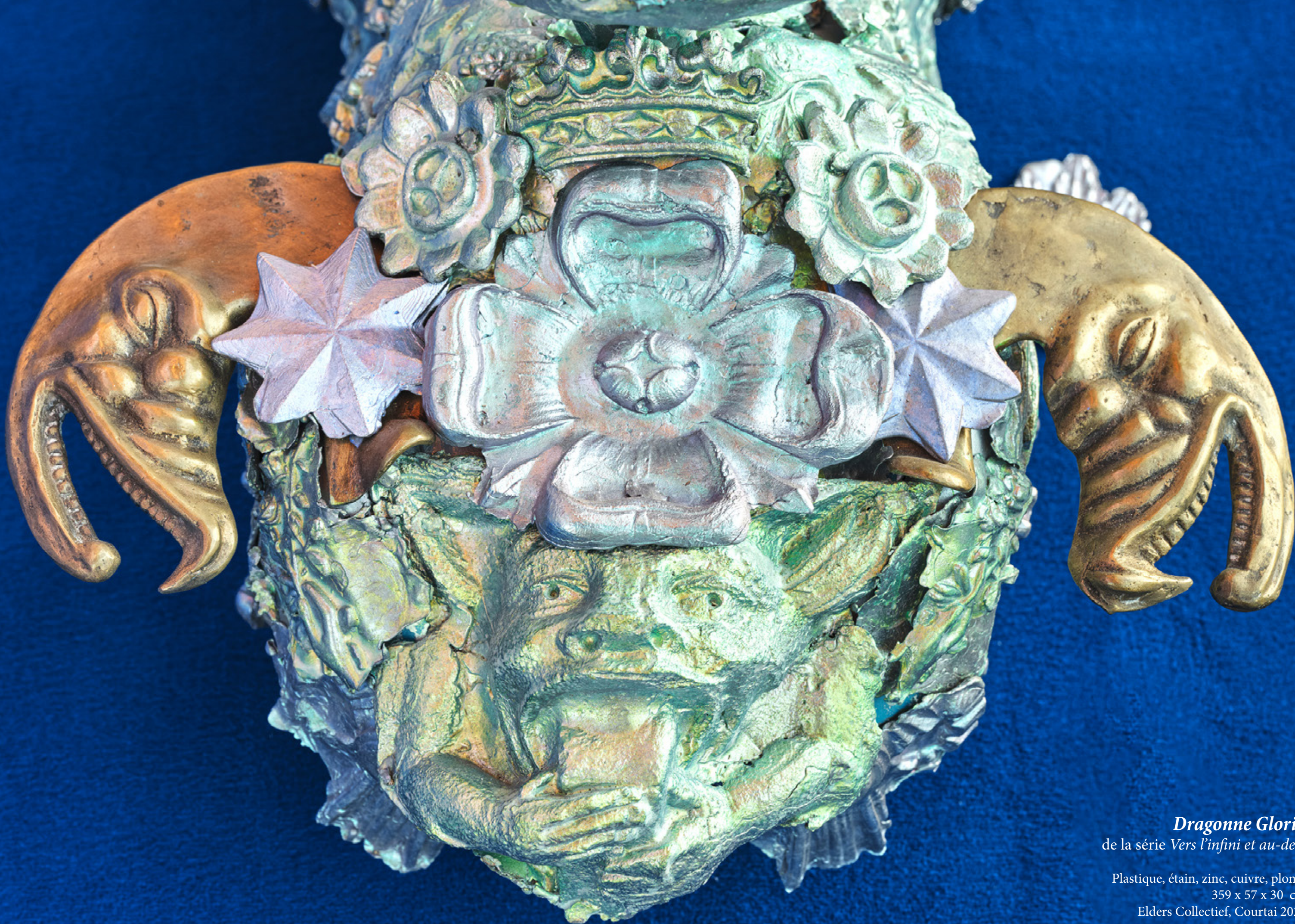
Dragonne Gloria de la série Vers l'infini et au-delà

Plastique, étain, zinc, cuivre, plomb 359 x 57 x 30 cm Elders Collectief, Courtaï 2024