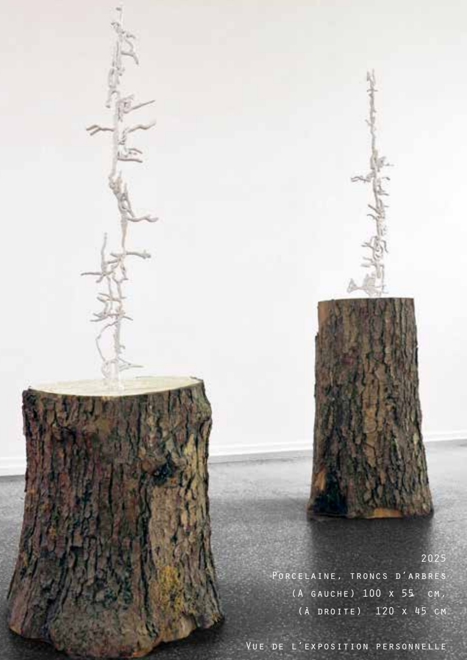
2025 PORCELAINE, TRONCS D'ARBRES (À GAUCHE) 100 x 55 CM, (À DROITE) 120 x 45 CM

LA BASE DES SCULPTURES, UN TRONC D'ARBRE BRUT, COUPÉ, TÉMOIGNE DE LA FORCE ORIGINELLE MAIS AUSSI DE LA VULNÉRABILITÉ DE LA FORÊT. IL ÉMANE DE SON CENTRE UNE SCULPTURE FINE ET FRAGILE, RÉALISÉE À PARTIR DES TRACES