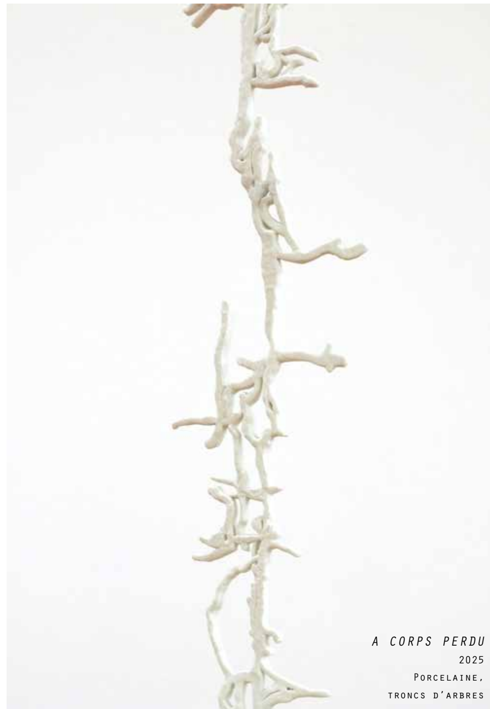
A CORPS PERDU 2025 PORCELAIN, TRONCS D'ARBRES