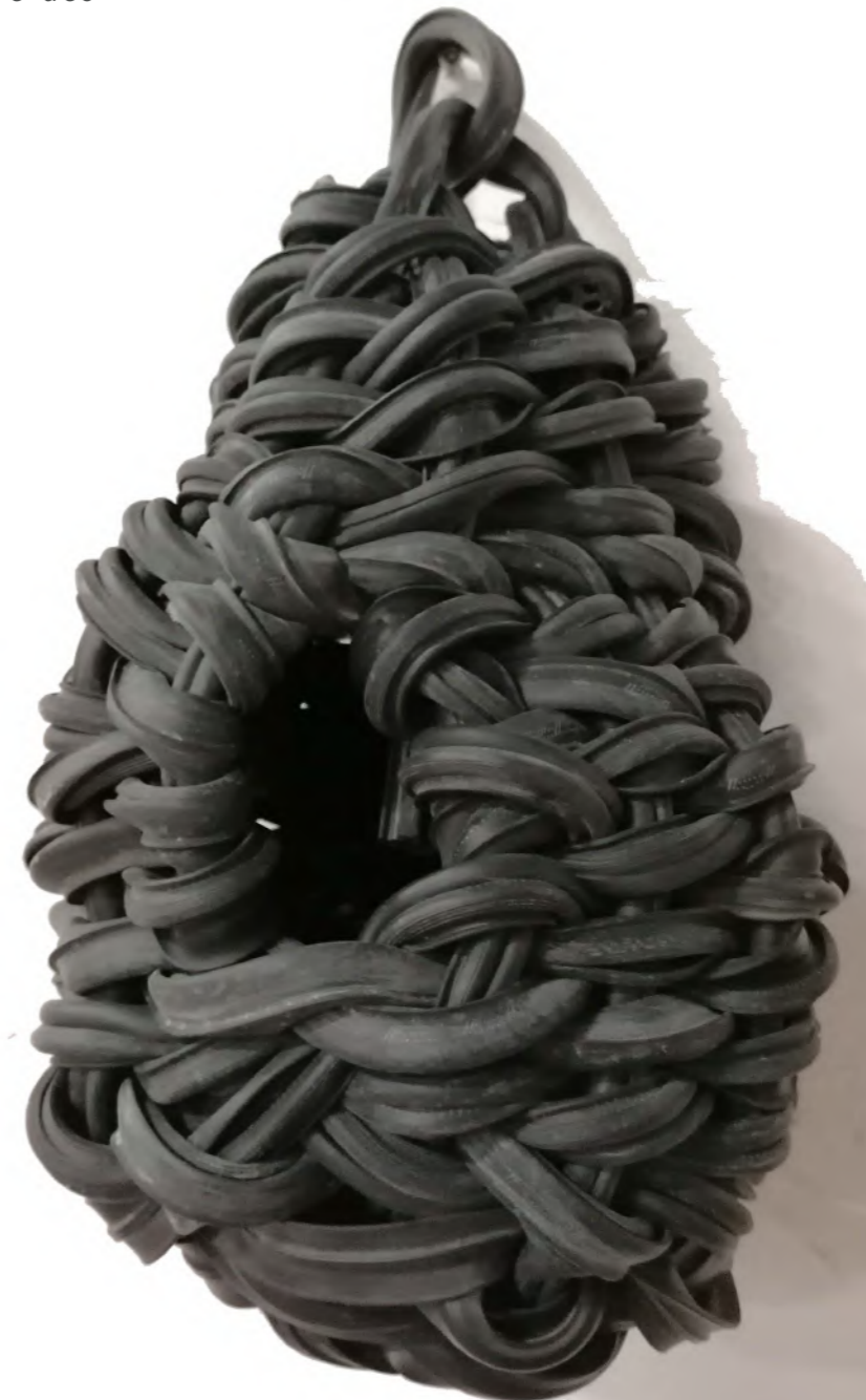
Nichoir, 2022 Joint de fenêtre récupéré

J'ai tissé des liens comme l'on tisse l'osier. J'apprenais chaque étape de la fabrication d'un panier auprès de femmes souhaitant perpétuer la transmission de ce savoir. D'abord, la récolte de l'osier et du châtaigner à l'automne. Puis commence l'apprentissage des gestes. Fendre, gratter, gratter les brins, les côtes, les côtes maîtresses. Tordre le bois sur ses genoux. Assembler et dessiner une ossature, un squelette encore nu, maintenu par deux «yeux», que l'on recouvrira d'une peau aux différentes nuances de couleurs. On se retrouvait chaque semaine et elles me répétaient que l'on pouvait faire un panier simplement avec un couteau et une forêt. Que l'on pouvait faire des paniers avec presque tout.