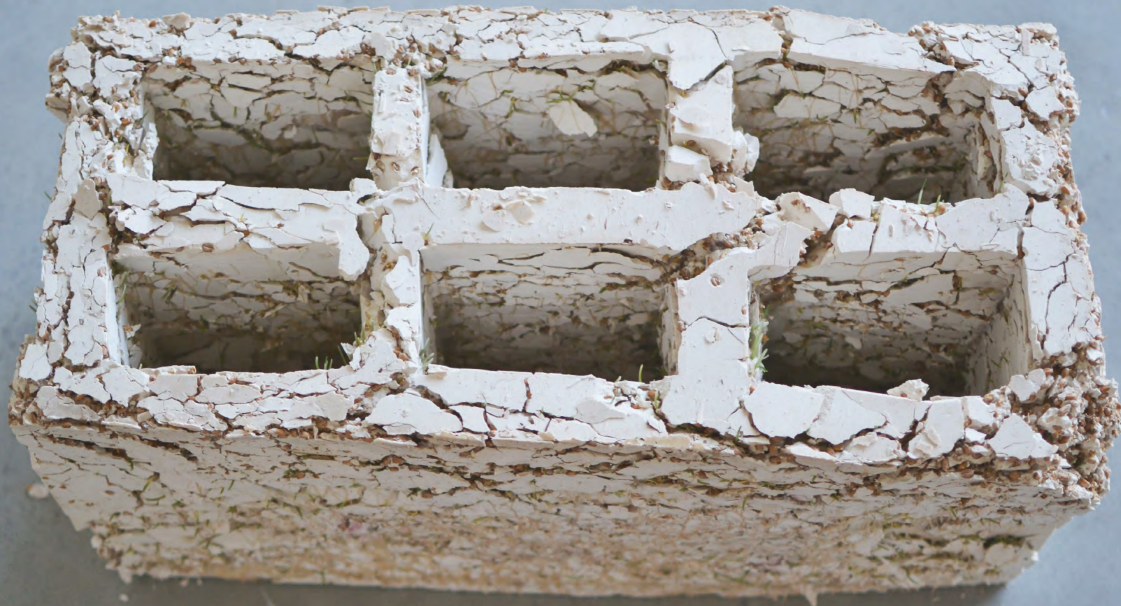
Cinquante par vingt , 2019 Plâtre, graines de blé