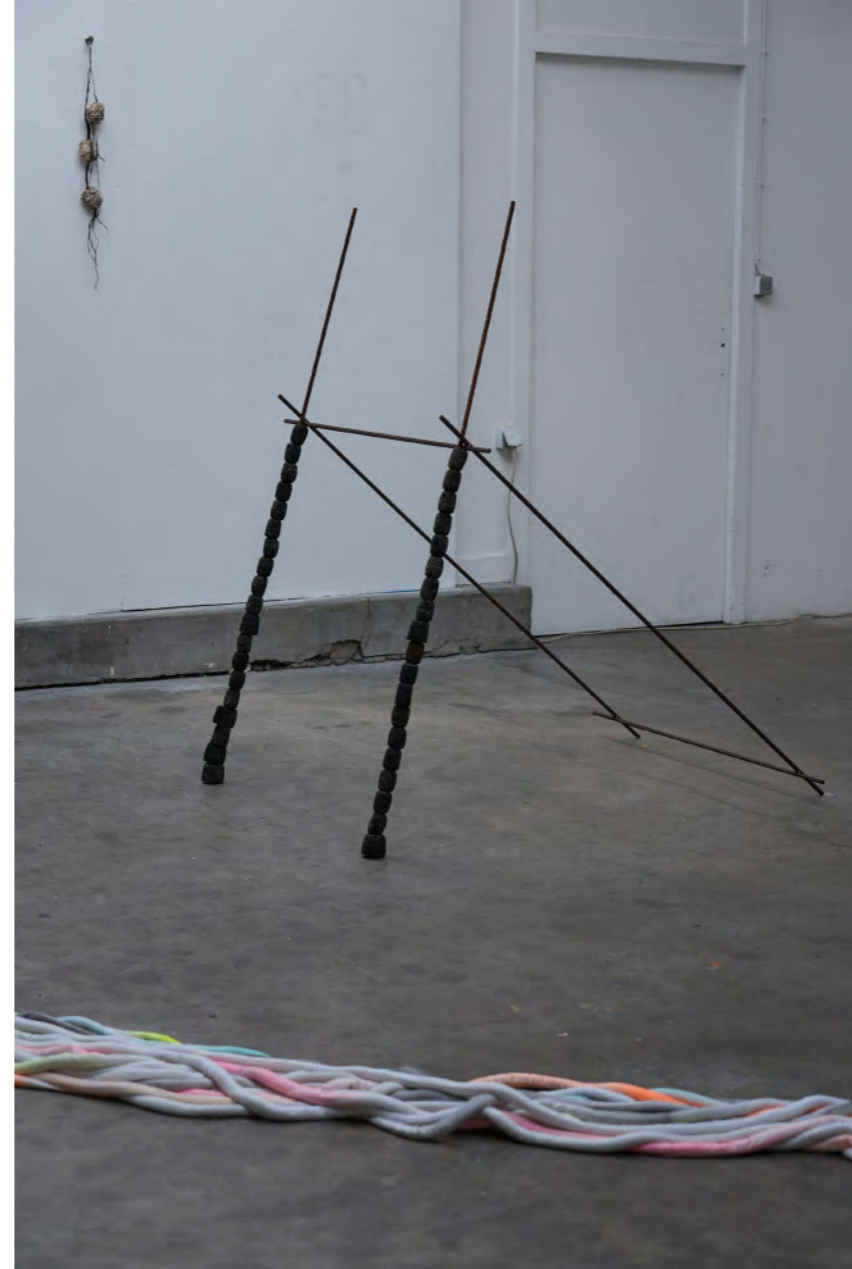
Quand la mer se retire, 2024 Fer à béton, flotteurs en caoutchouc, dimensions variables Vue de l'exposition (Re)flux, l'infini des marées avec Joséphine Javier, Ateliers de la Ville en Bois, Nantes