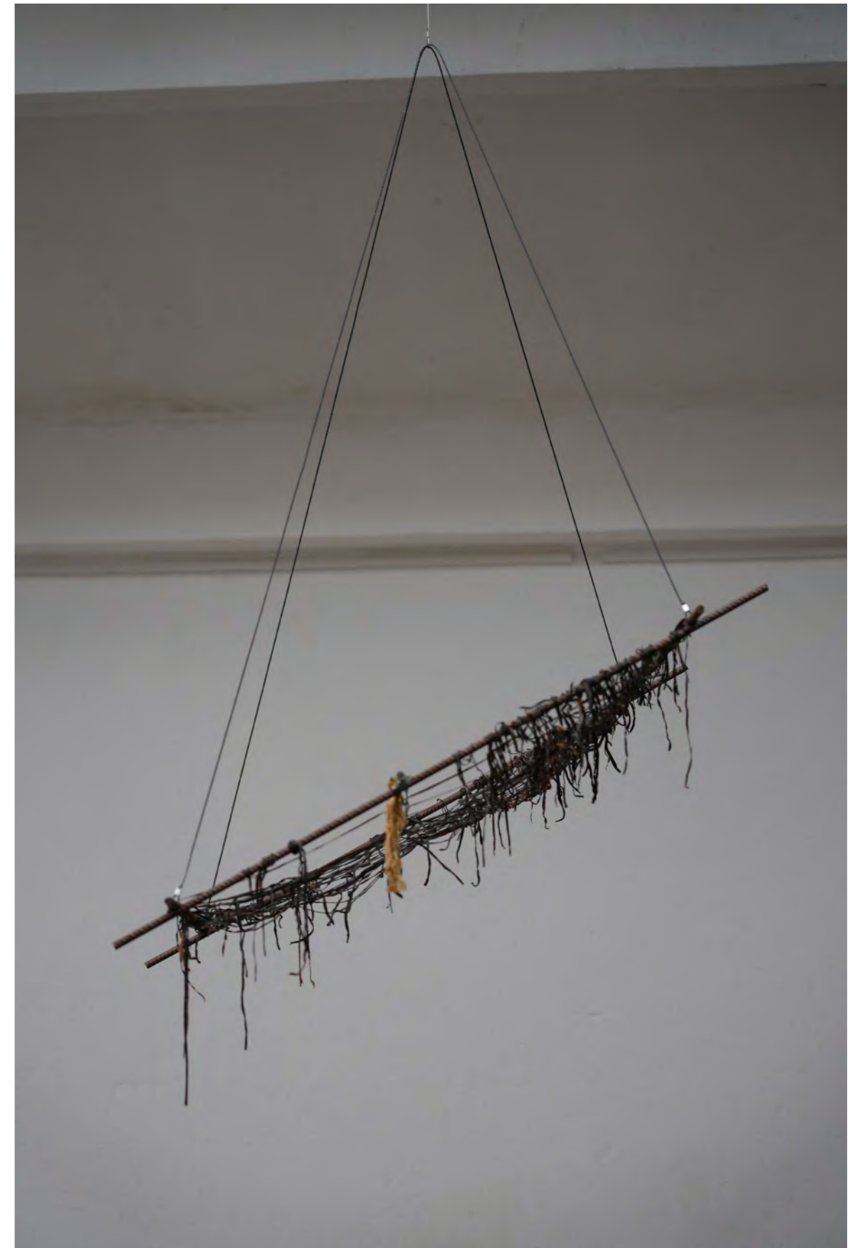
Quand la mer se retire , 2024 Fer à béton, tissage d'algues, dimensions variables Vue de l'exposition (Re)flux, l'infini des marées avec Joséphine Javier, Ateliers de la Ville en Bois, Nantes