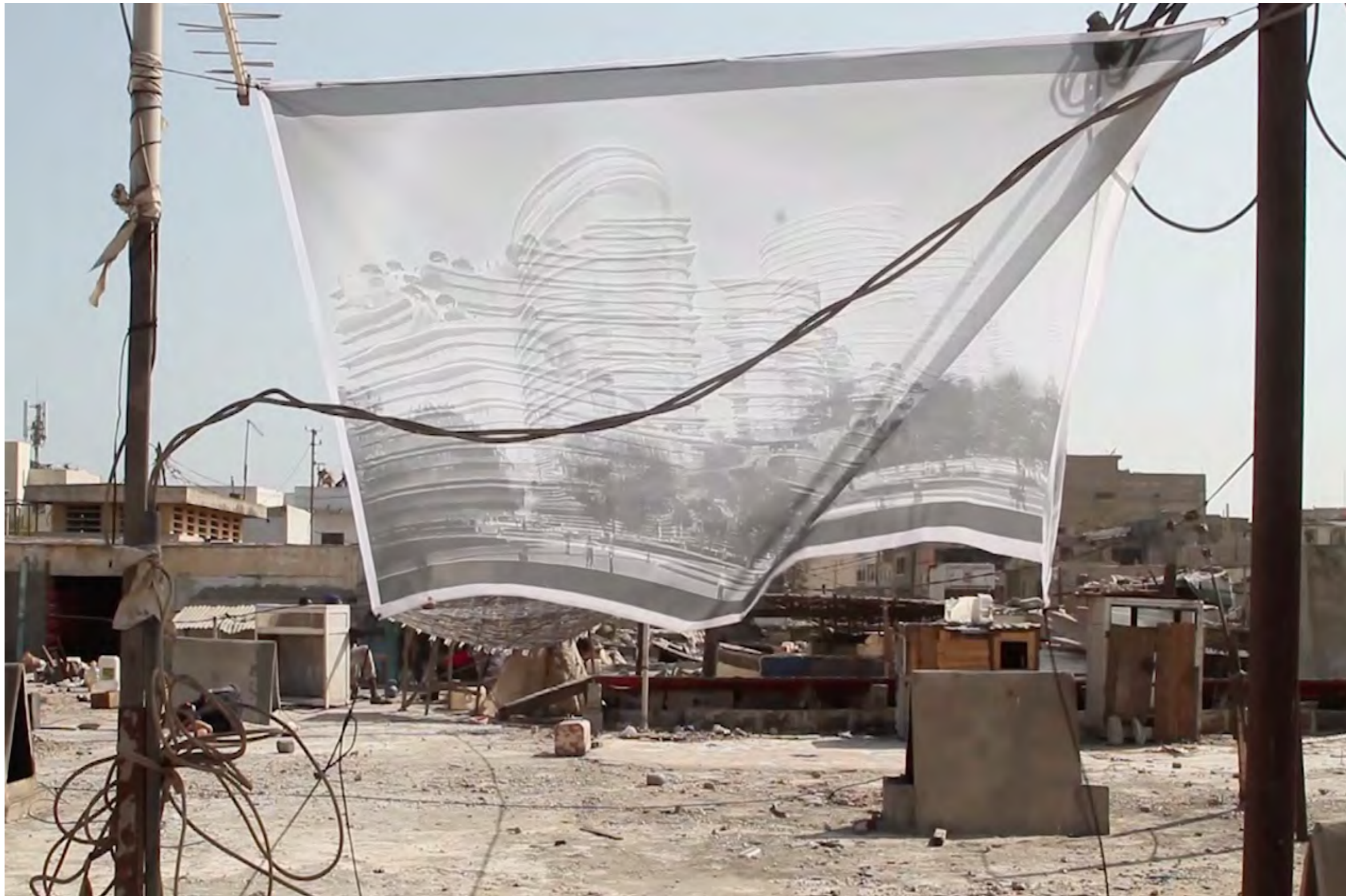
Sans transition, 2019

Installation sur le toit d'un marché dans le quartier de Pikine (Dakar), tissu imprimé avec vue 3D du projet de Diamniadio Lake City, captation vidéo