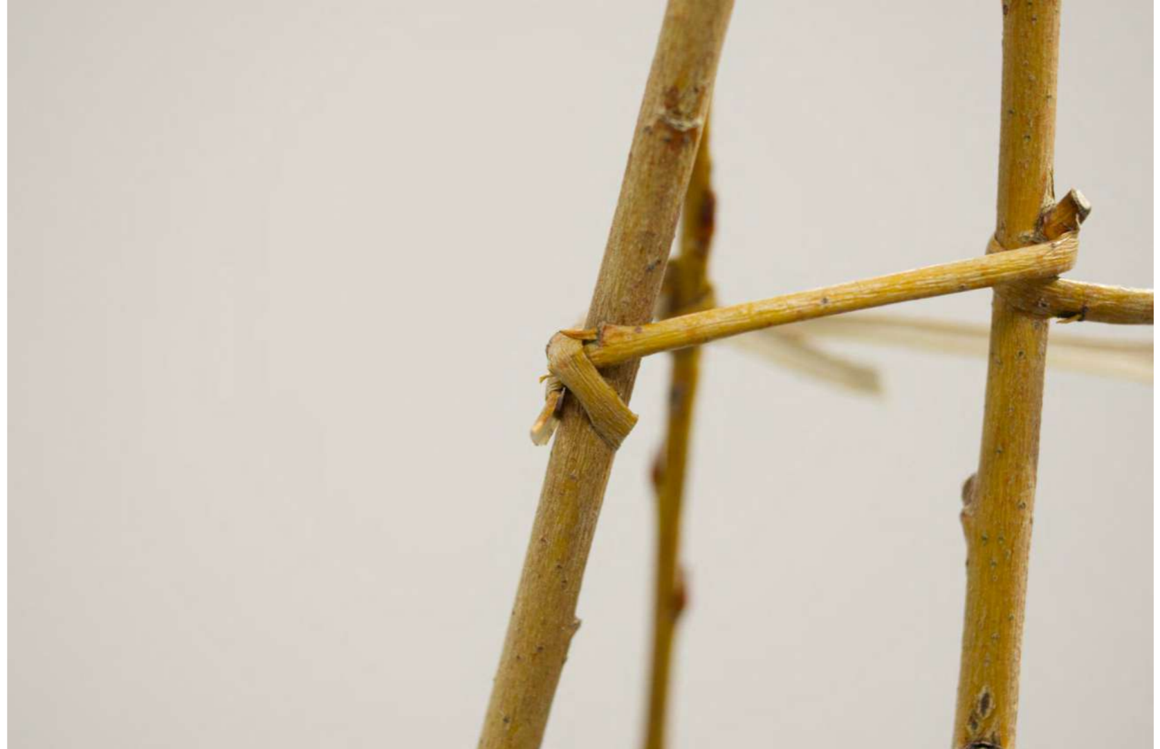
Le murmure des cimes, 2024 Osier, plâtre

Vues de l'exposition Régissent, le côté obscur de la forme - partie 2 à la galerie Open school, Beaux Arts de Nantes, commissariat Hélène Cheguillaume et Léo Bioret