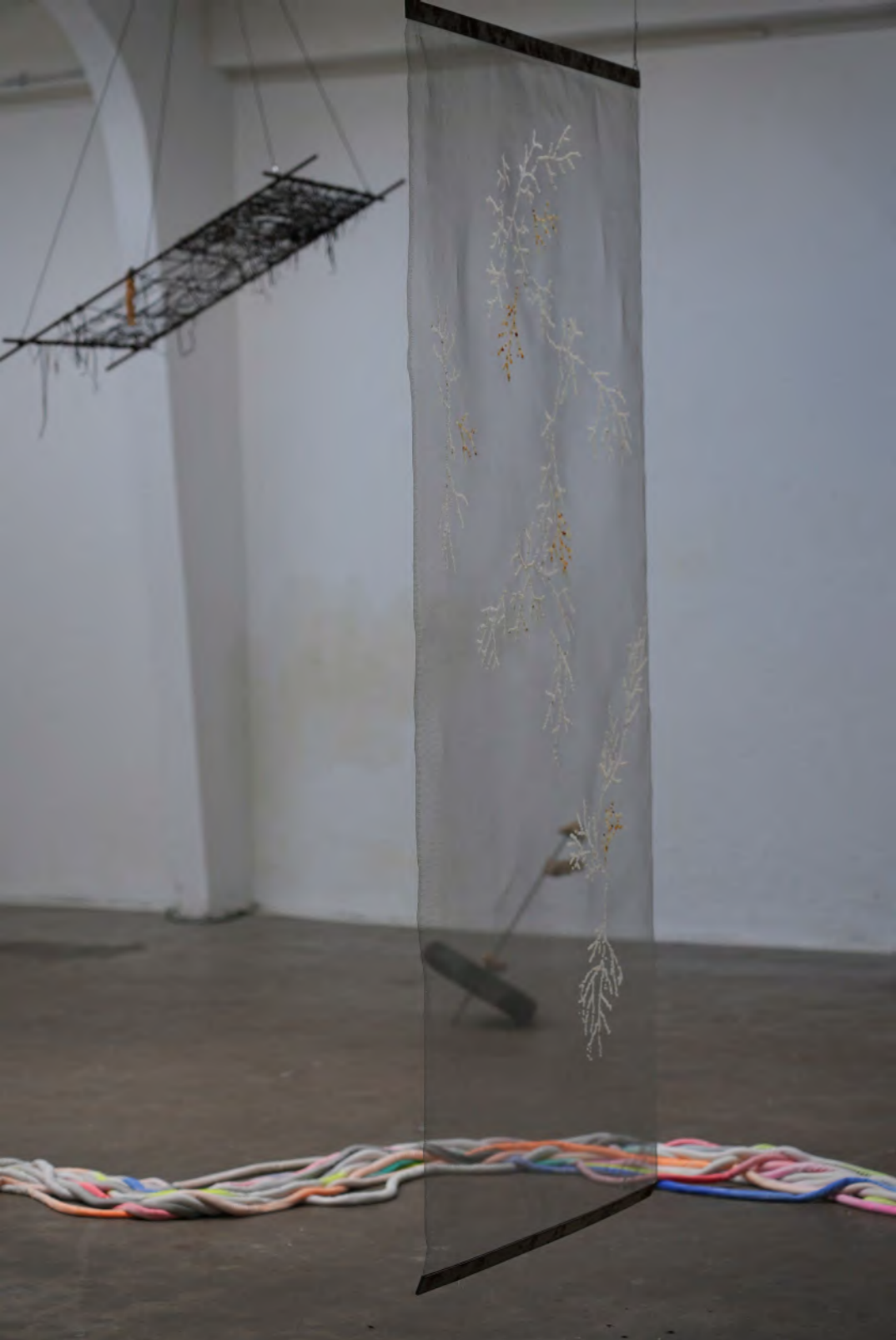
Les larmes de sirène, depuis 2022