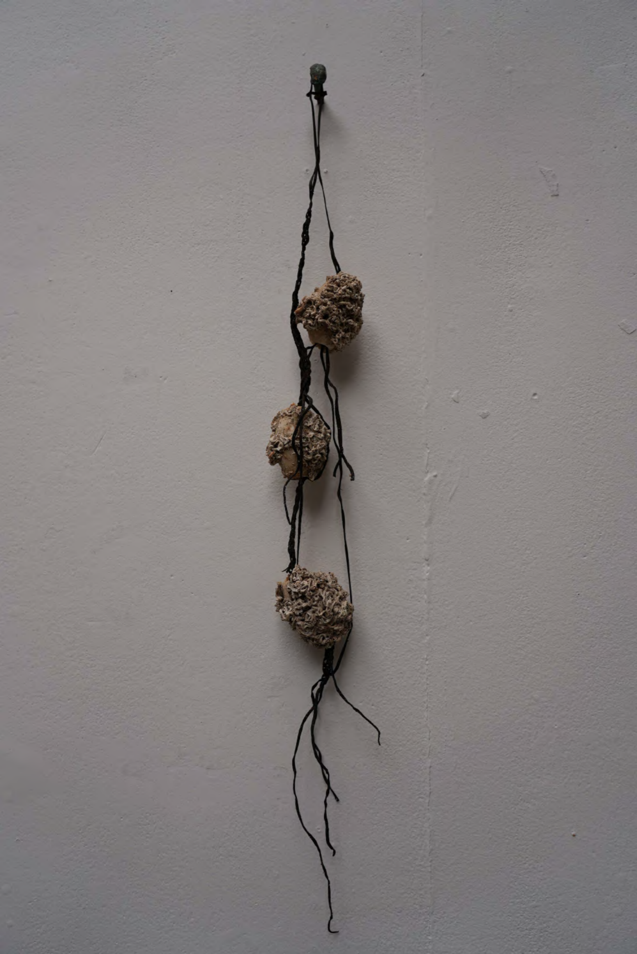
La chevelure de Canalipata, 2024 Algues, flotteurs en plastique, habitats calcaires de serpulidae, clou en cuivre