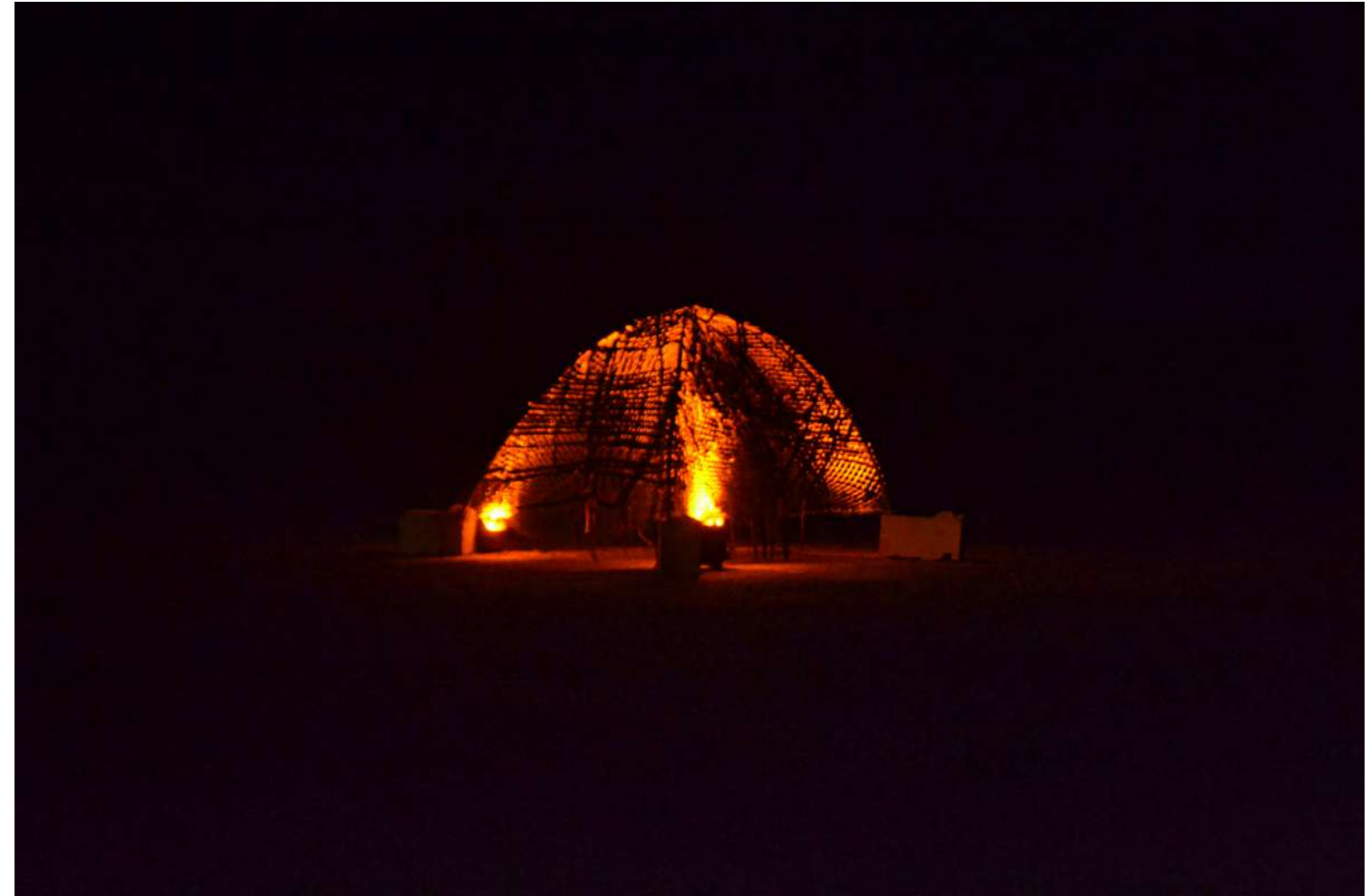
Tissons les mailles d'un abri sans écailles, 2024 Vue de l'installation suite à l'atelier participatif A la tombée de la nuit, l'abri est devenu foyer incandescent.