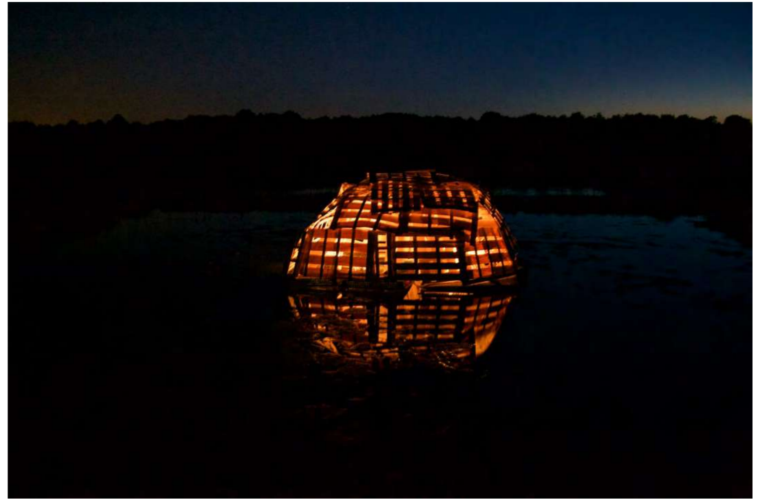
La veillée, 2016 Installation in situ, caquettes en bois et plastique, bougies