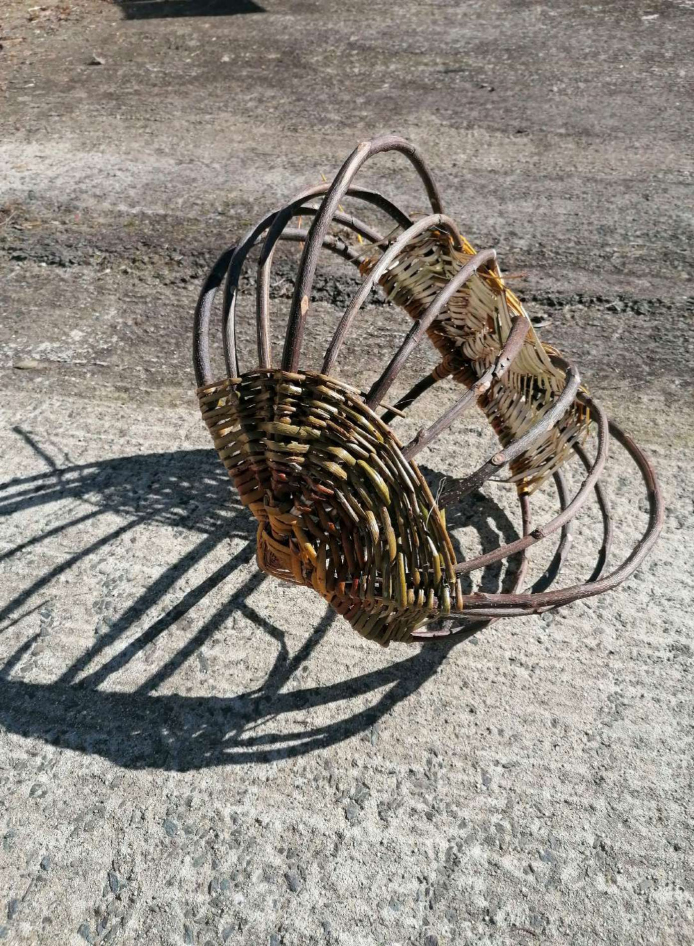
Panier en cours, 2022 Osier et châtaigner

J'ai tissé des liens comme l'on tisse l'osier. J'apprenais chaque étape de la fabrication d'un panier auprès de femmes souhaitant perpétuer la transmission de ce savoir. D'abord, la récolte de l'osier et du châtaigner à l'automne. Puis commence l'apprentissage des gestes. Fendre, gratter, gratter les brins, les côtes, les côtes maîtresses. Tordre le bois sur ses genoux. Assembler et dessiner une ossature, un squelette encore nu, maintenu par deux «yeux», que l'on recouvrira d'une peau aux différentes nuances de couleurs. On se retrouvait chaque semaine et elles me répétaient que l'on pouvait faire un panier simplement avec un couteau et une forêt. Que l'on pouvait faire des paniers avec presque tout.