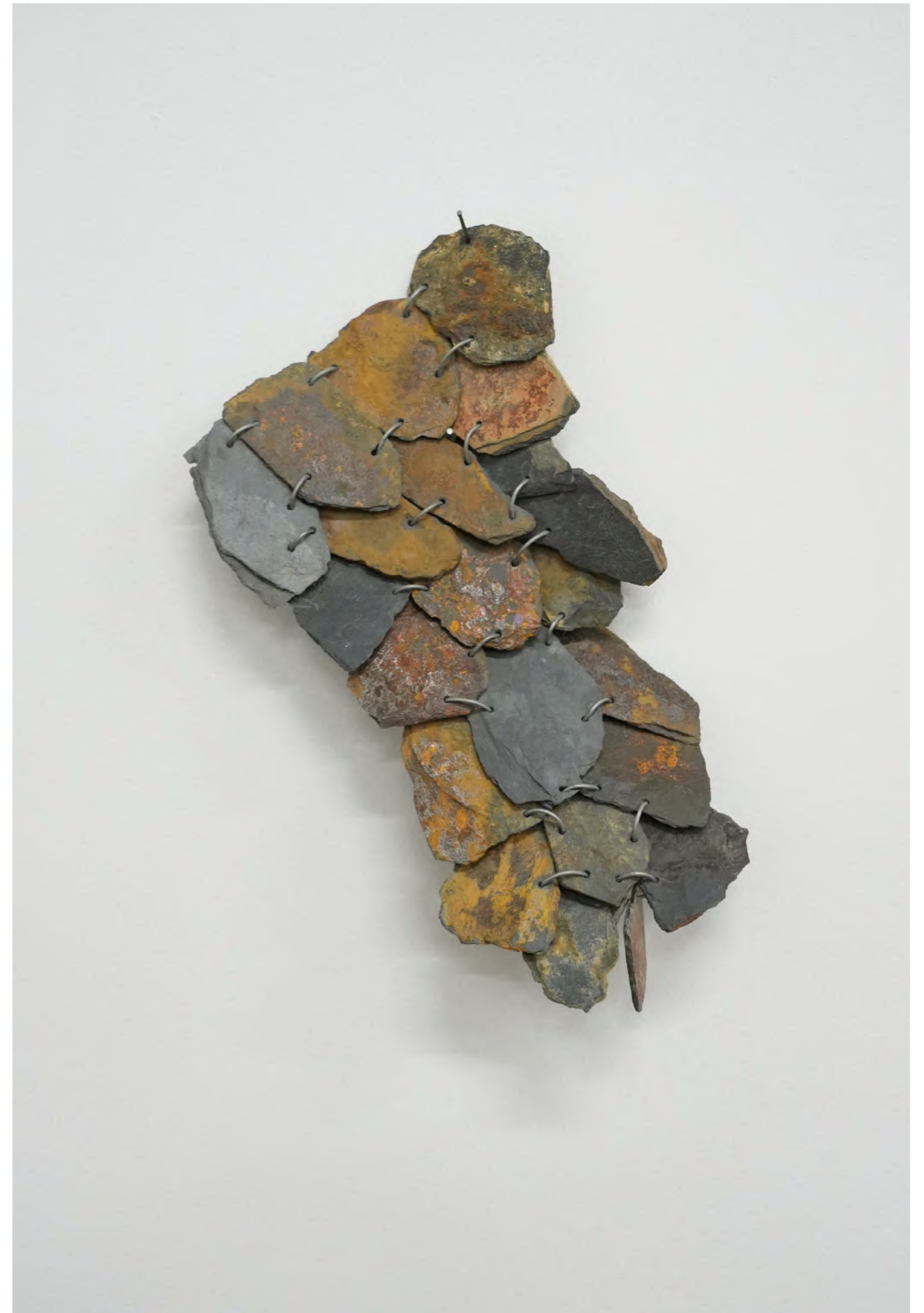
Ecorce, 2022 Ardoises glanées, fil de fer