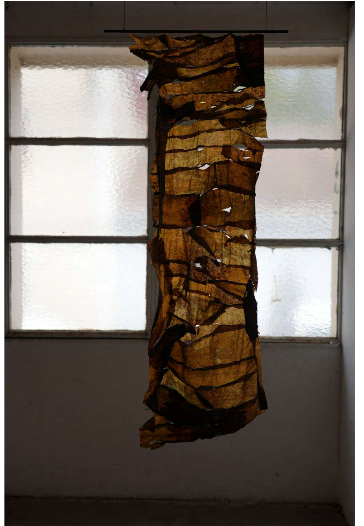
Sa peau s'érode , 2024 Algues laminaires, fil de coton, tige d'acier, Vue de l'exposition (Re)flux, l'infini des marées avec Joséphine Javier, Ateliers de la Ville en Bois, Nantes