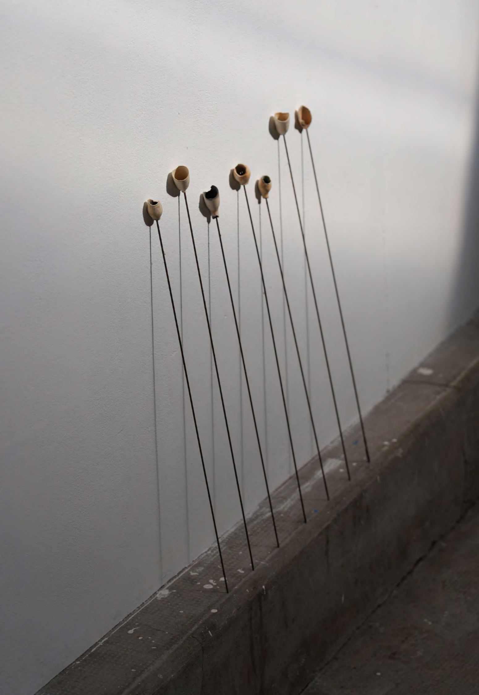
Elles partent en fumée, 2024 Tiges en acier, morceaux d'anciennes pipes en argile