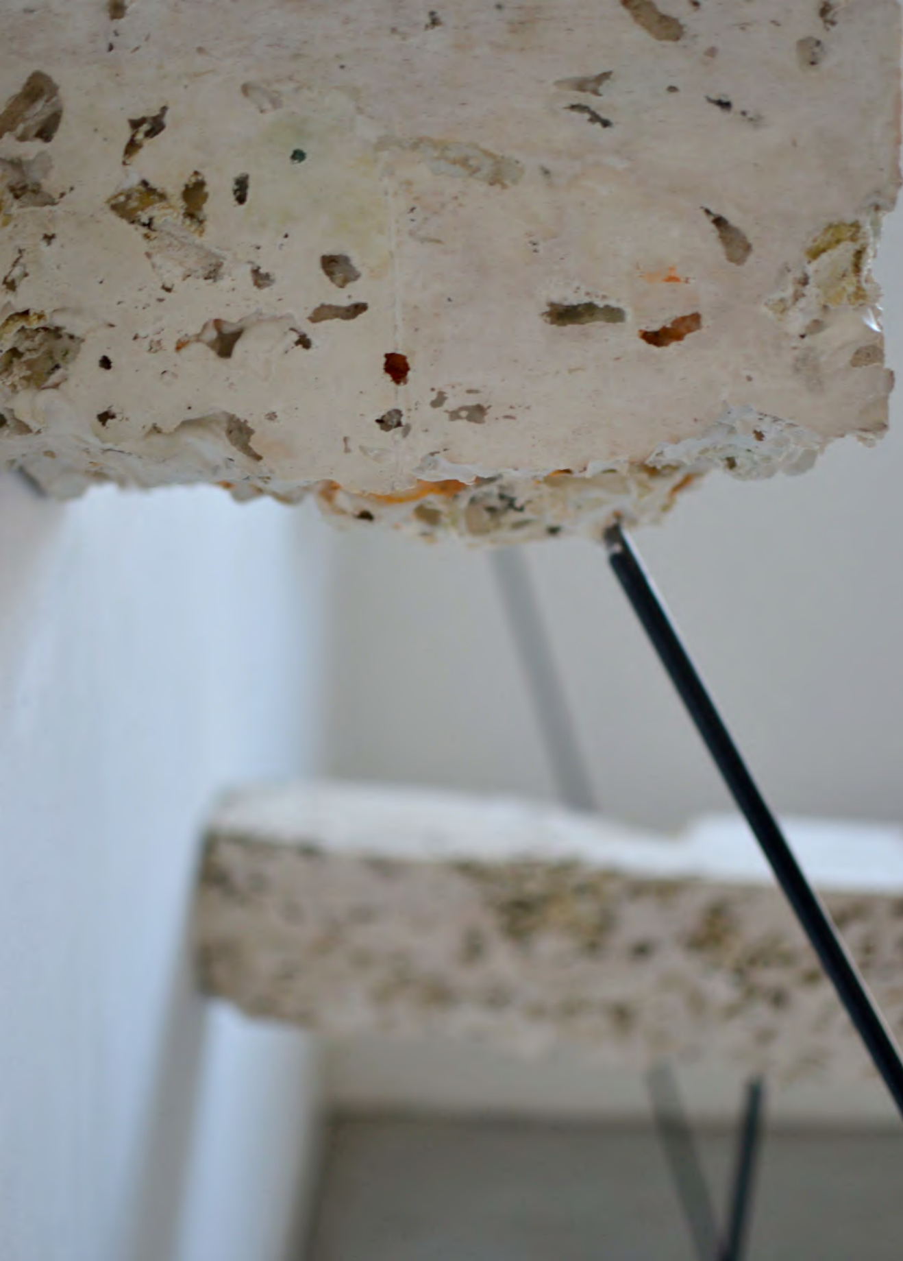
Porte-à-faux , 2019 métal, plâtre, polystyrènes de maïs

Fragments d'architectures ou extractions souterraines, cet ensemble reflète un équilibre précaire de la matière. Ces blocs parcelaires sont friables et le plâtre qui les constitue tend à se fragiliser d'avantage à travers le développement des moisissures créées par le polystyrène de maïs, jusqu'à un potentiel effondrement.