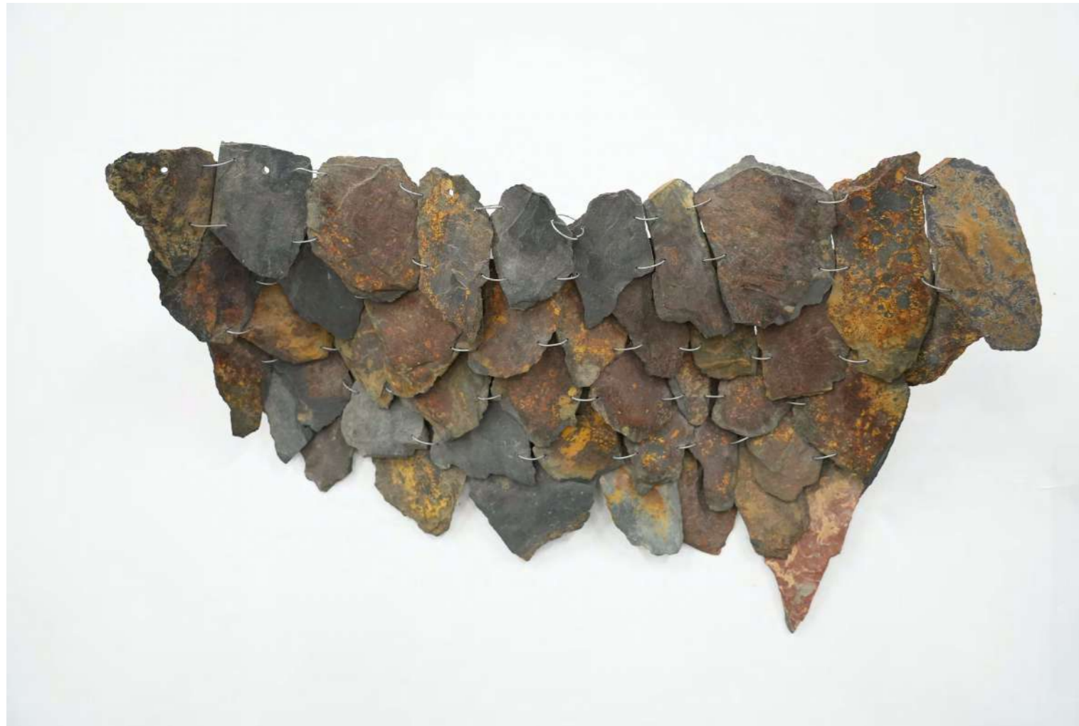
Exuvia, 2025, ardoises glanées, fil de fer