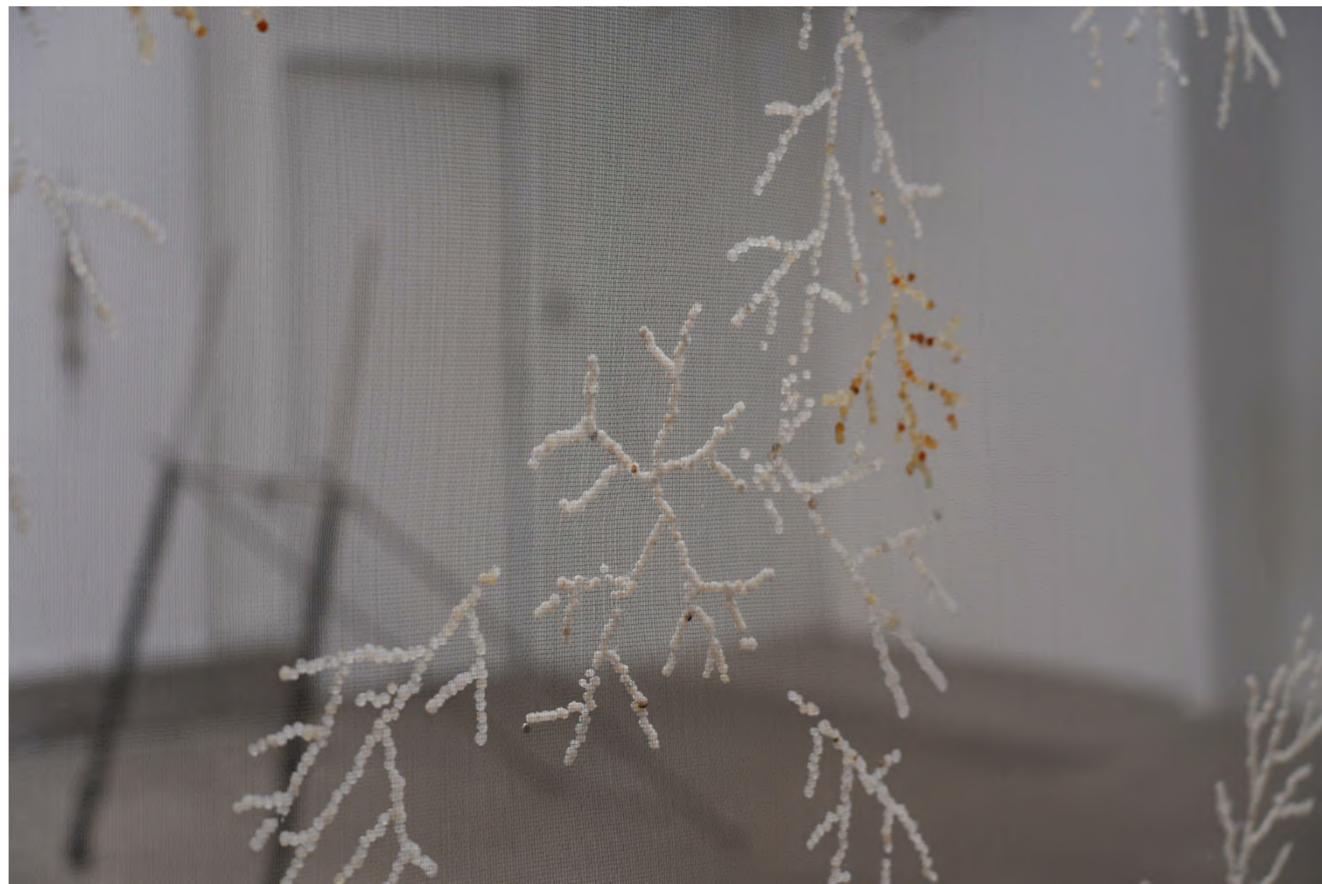
De leurs larmes naissent de nouveaux rivages, 2024

Une partie de ces recherches formelles ont été déployées, puis exposées, suite à une résidence d'un mois aux Ateliers de la Ville en Bois à Nantes.