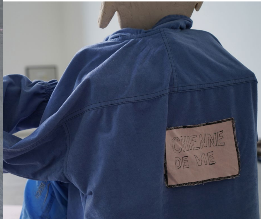
CHIENNE DE VIE, 2024 Installation, dimensions variables tissu, encre sur papier, plâtre