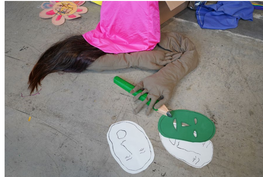
EN ATTENDANT, détail de l'installation

Lien sonore : https://soundcloud.com/portelouise/en-attendant