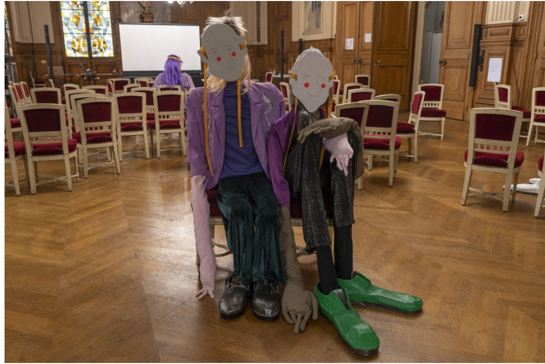
ÇA COMMENCE À PEU PRÈS COMME ÇA, 2025 détails de l'installation