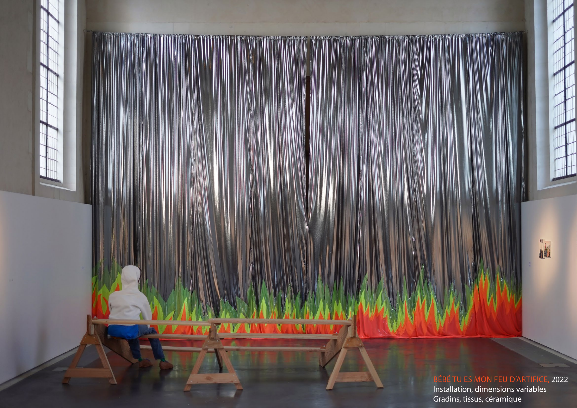
BÉBÉ TU ES MON FEU D'ARTIFICE , 2022 Installation, dimensions variables Gradins, tissus, céramique