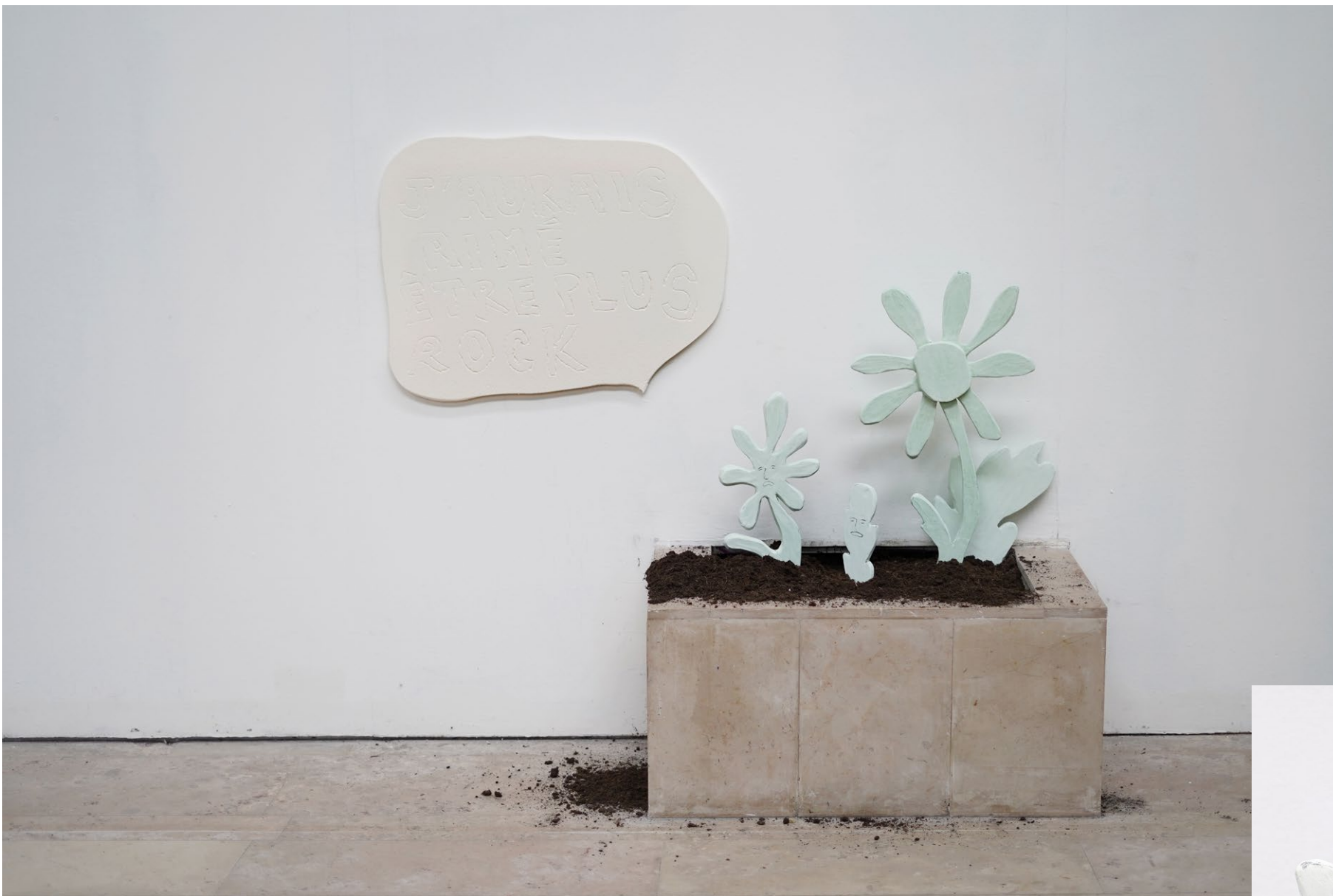
APRÈS TOUT, 2023 Vues de l'exposition après tout, à La Serre, Saint-Etienne

elle dit, j'aurais voulu être plus rock., 2023 série de sculptures gravées, polystyrène, enduit dimensions variables