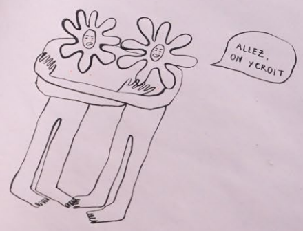
CHIENNE DE VIE, 2024 Installation, dimensions variables tissu, encre sur papier, plâtre

FACE A MOI IL TA UN HUMAIN EN FORME DE SOLEIL OU SACHET DE THE OU SARDINE ET TOI TU LEUR RALONIES DES HISTOIRES DANS L'OREILLE. CA FAIT DE LA CHALEUR DANS CE VENT FRAIS QUI NOUS GLACE LE CORS. CA CA ME RASSURE QUE DES GENS SE DEGUISENT ET TRENNENT CE TEMPS LA DE SE FABRIQUER DES COSTUMES. CA ME RASSURE D'EXPLOIER DE RIRE ENCORE QUAND MEME. CA ME RASSURE QU'IL RESTE DE L'ABSURDE HILARANT. HILARANT.