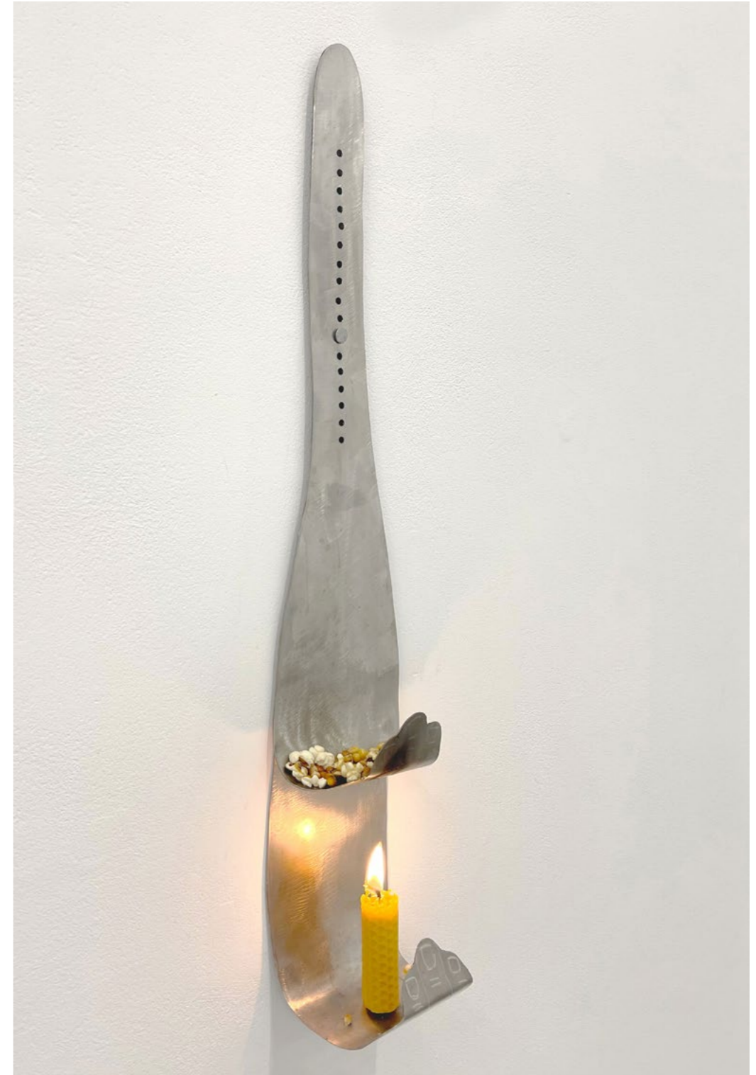
180°C , 2024, machine à pop corn. Inox, bougie en cire d'abeille, maïs à éclater

Il faudra atteindre 180 degrés pour que l'humidité présente dans le grain de maïs s'évapore et laisse voir sa furtive explosion.