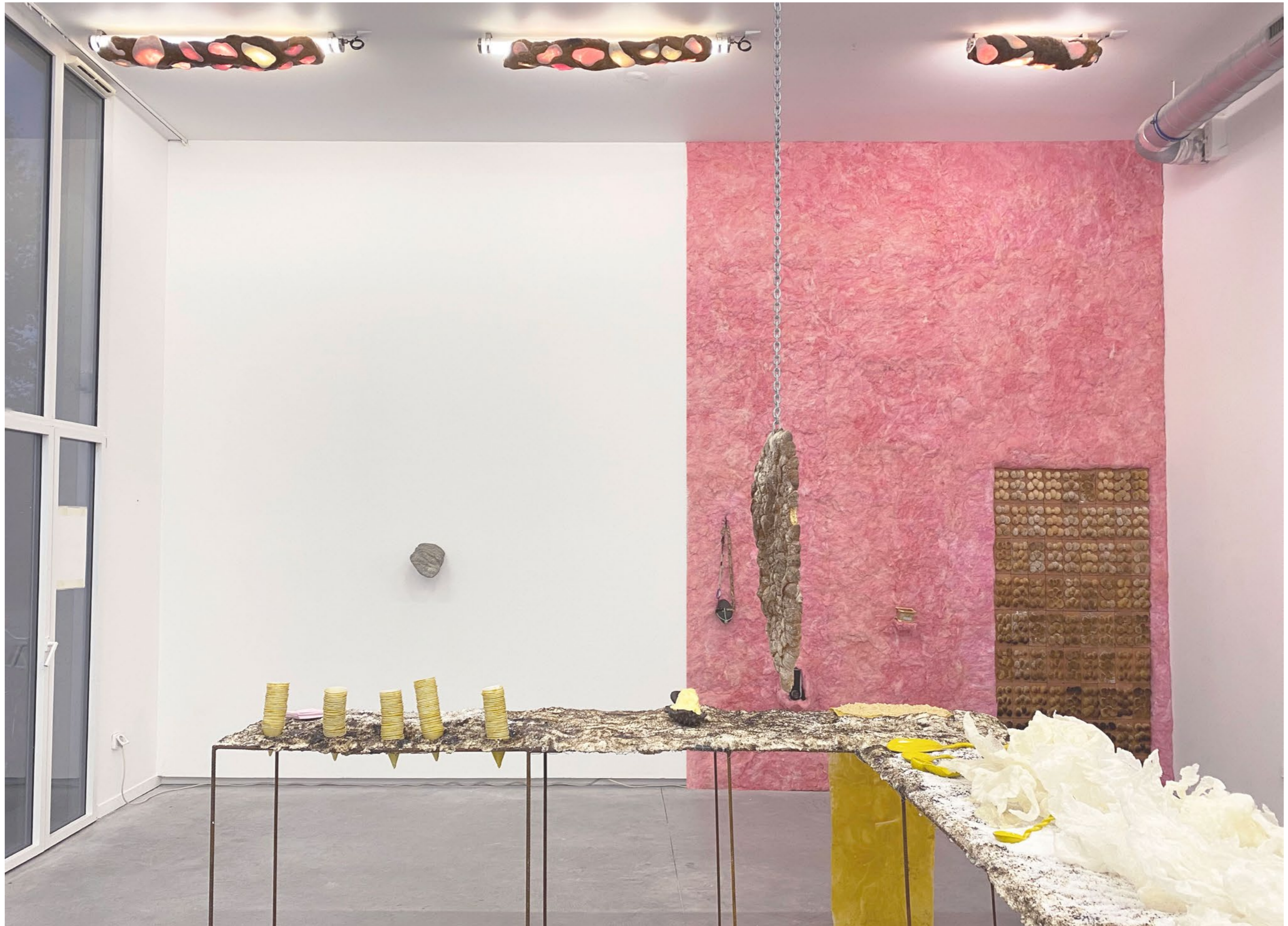
Vue de l'exposition Chubby club , novembre 2022, Atelier 8, Nantes. Projet soutenu par la DRAC Pays de la Loire.