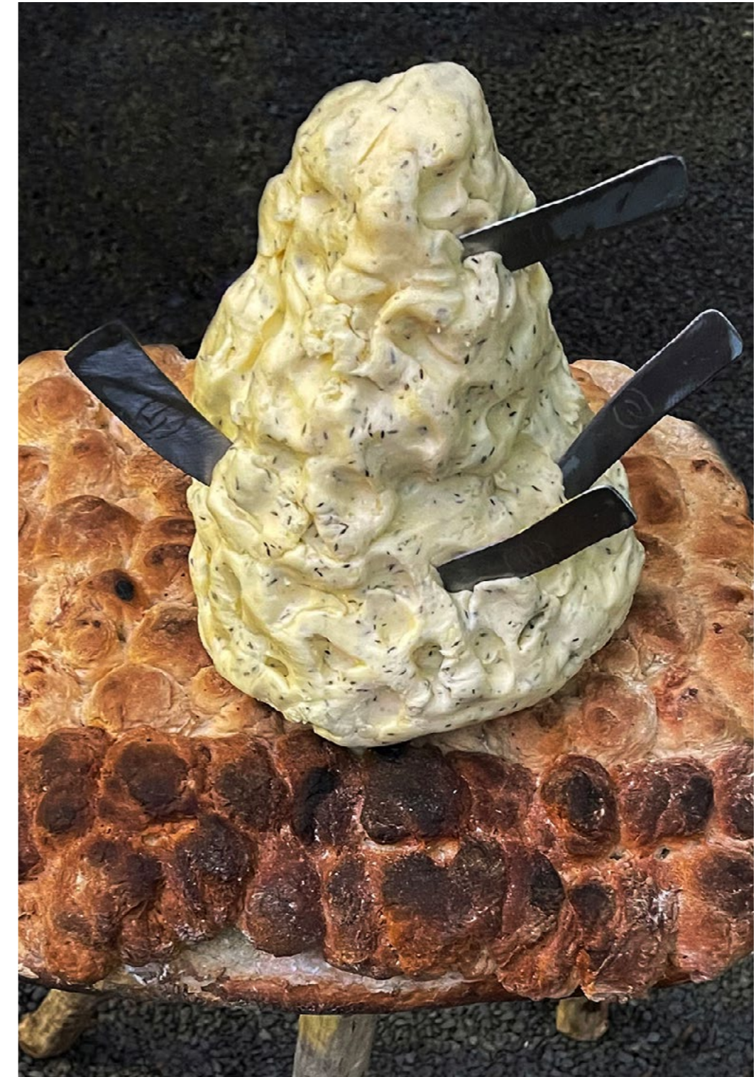
Pain surprise , série de sculptures, 2023, pain, beurre-thym-ail, bois et métal