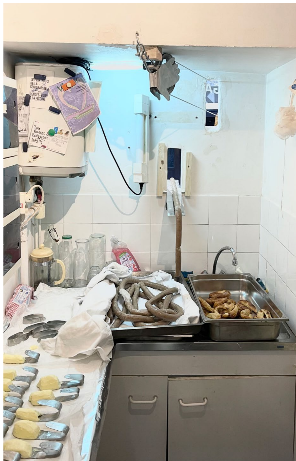
Vue de la kitchenette qui me permettait d'envoyer le pain, le beurre et de dérouler la saucisse végétale du dispositif Premier Service , dans l'exposition Le Repas , au Virage à Quimper.