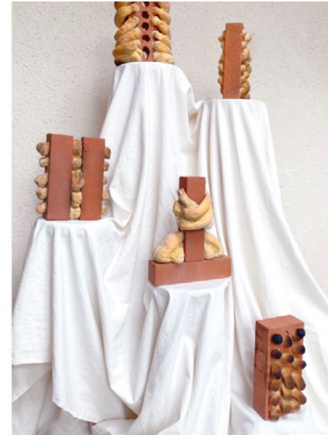
Les Dodus , série de sculptures, 2022, du pain déborde de briques en terre cuite