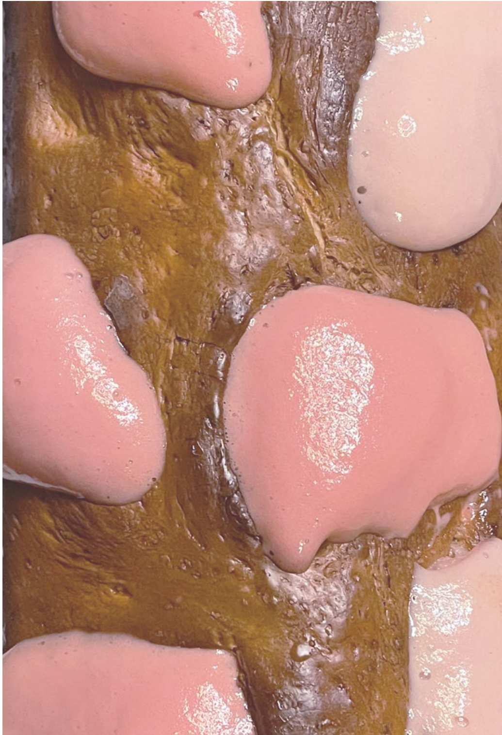
Club-sandwich , 2024, pain, mousse polyuréthane expansée, chaîne métallique

Club-sandwich est une série de sculptures où le pain se voit débordé par de la mousse polyuréthane teintée. Je m'intéresse aux matériaux polymorphes, ceux qui ont cette capacité à mouvoir, à s'expanser, à nous échapper. Ici, la forme en pain est empruntée à la fougasse. Cette dernière est considérée comme le pain de l'expérimentation chez les boulangers, car il est le premier à passer au four pour en vérifier la bonne température. Cette image correspond à ma façon d'envisager la sculpture.