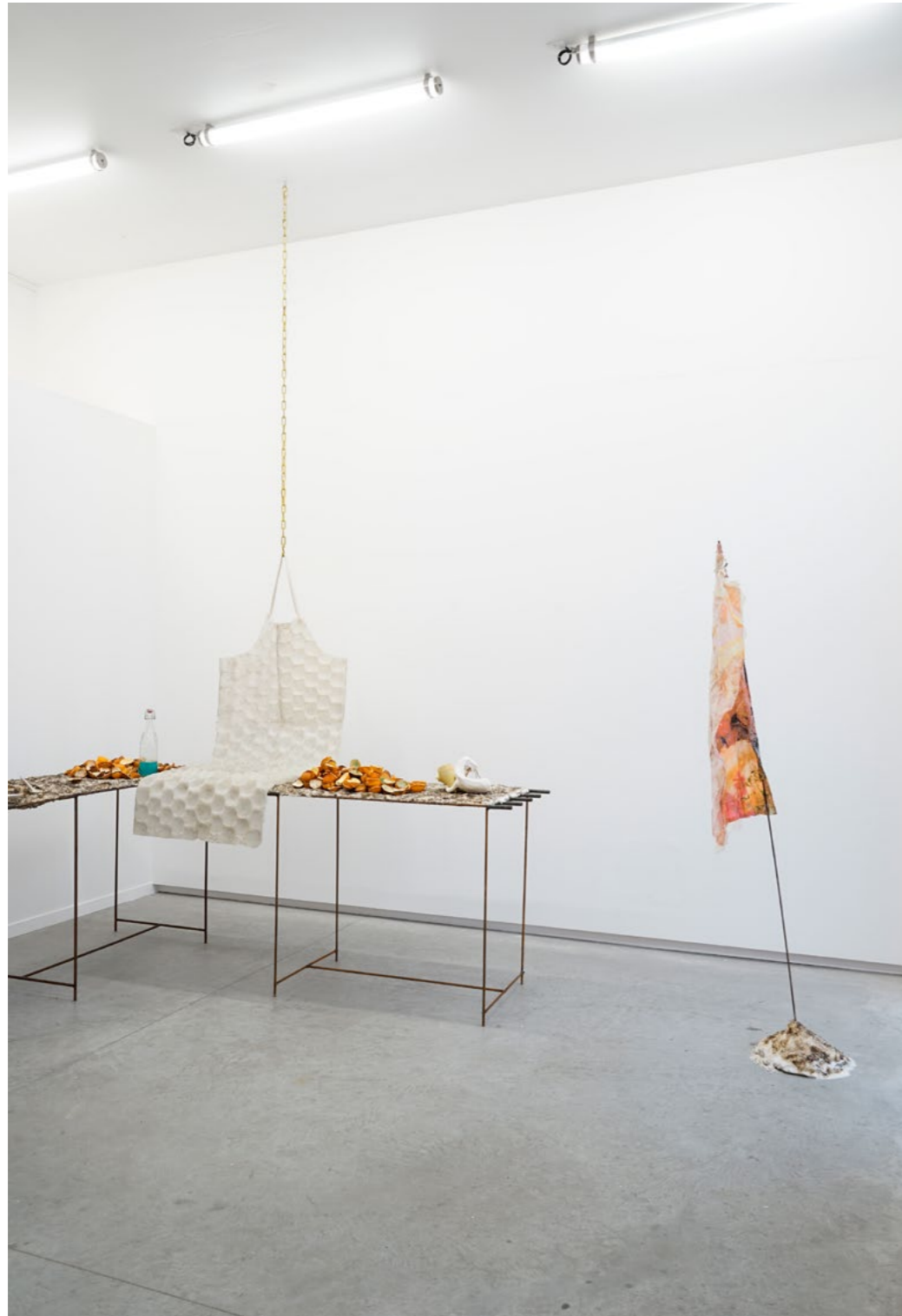
Vue de l'exposition Chubby club , 2022, Atelier 8, Nantes. Shot is the fruit, Hot is the pulp , 2022, Alban Turquois, filtre d'amour servi dans des coques d'oranges séchées ; Le Blop Blop , 2022, Clélia Berthier, un tablier/ nappe en silicone accompagne le service du cocktail ; Tempura 2 , Loona Sire & Clélia Berthier, 2022, une photo de Loona est trempée dans une pâte de riz puis frite.