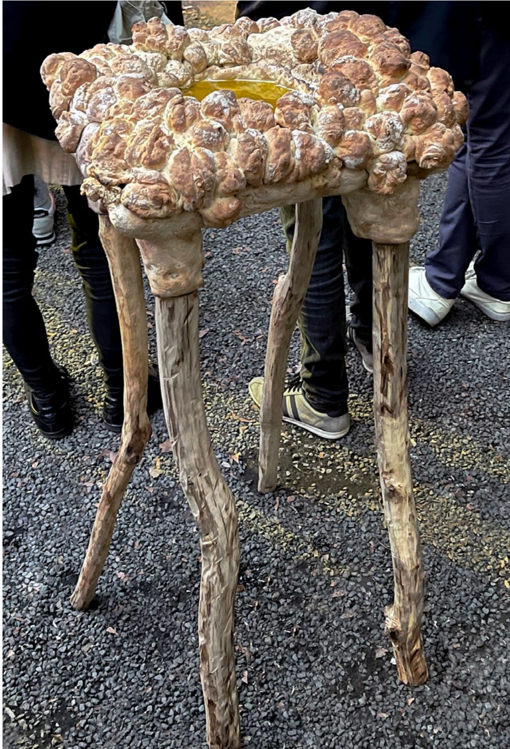
Pain surprise , série de sculptures, 2023, pain, huile d'olive, bois et métal