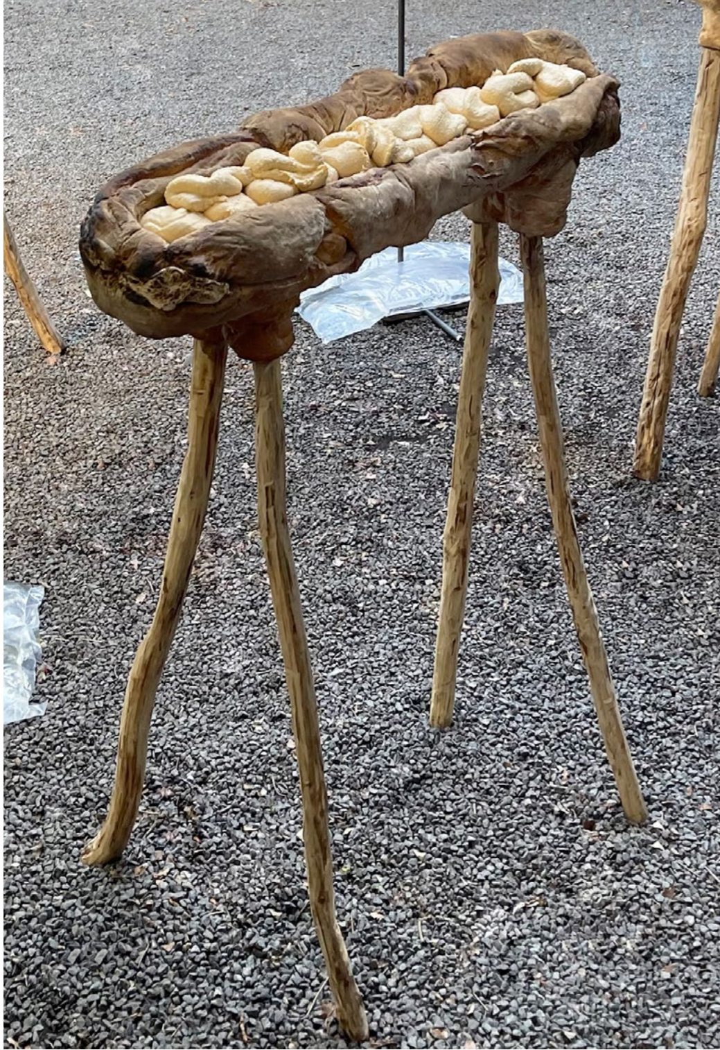
Pain surprise , série de sculptures, 2023, pain, houmous, bois et métal