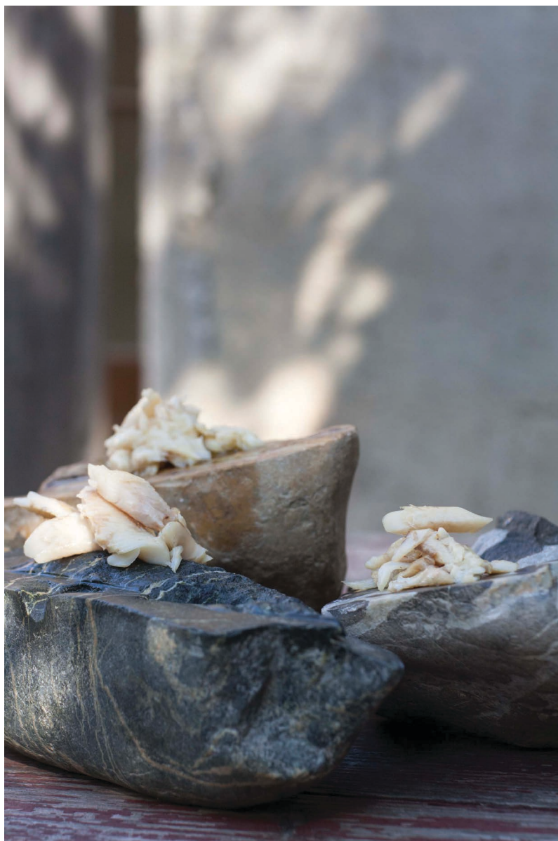
© Camille Orlandini, Les bords du Buëch, 2021