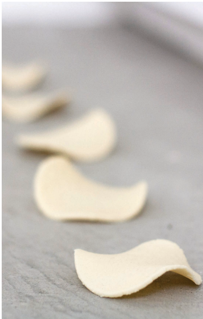
© Camille Orlandini, pierres de lait, 2023

Éditions en risographie, tissage fil de coton et foin, pierres de lait, dessins, photographie imprimée sur dibon, tissus, seau, deux bandes sonores: entretiens avec les artistes et habitant.e.s de l'Îlot des Îles autour du lait et sons enregistrés dans le laboratoire de la laiterie, archives, billes de mozzarella et lait chaud infusé à l'aneth et au fenouil.