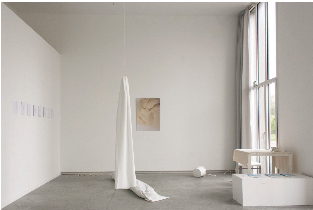
© Camille Orlandini, vue de l'exposition Mozzare, 2023