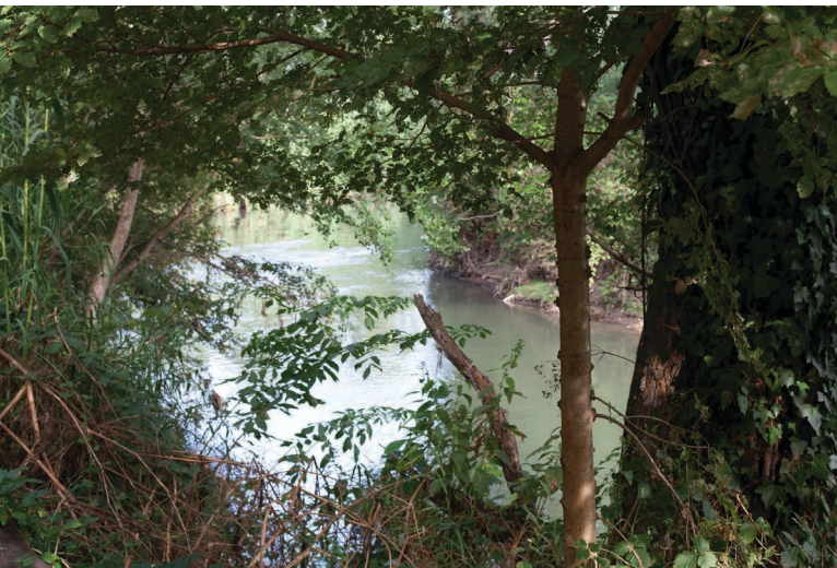
Faire pain commun, les bords de l'Aniene, affluent du Tibre et le champ de blé, dessin collectif à la tempera