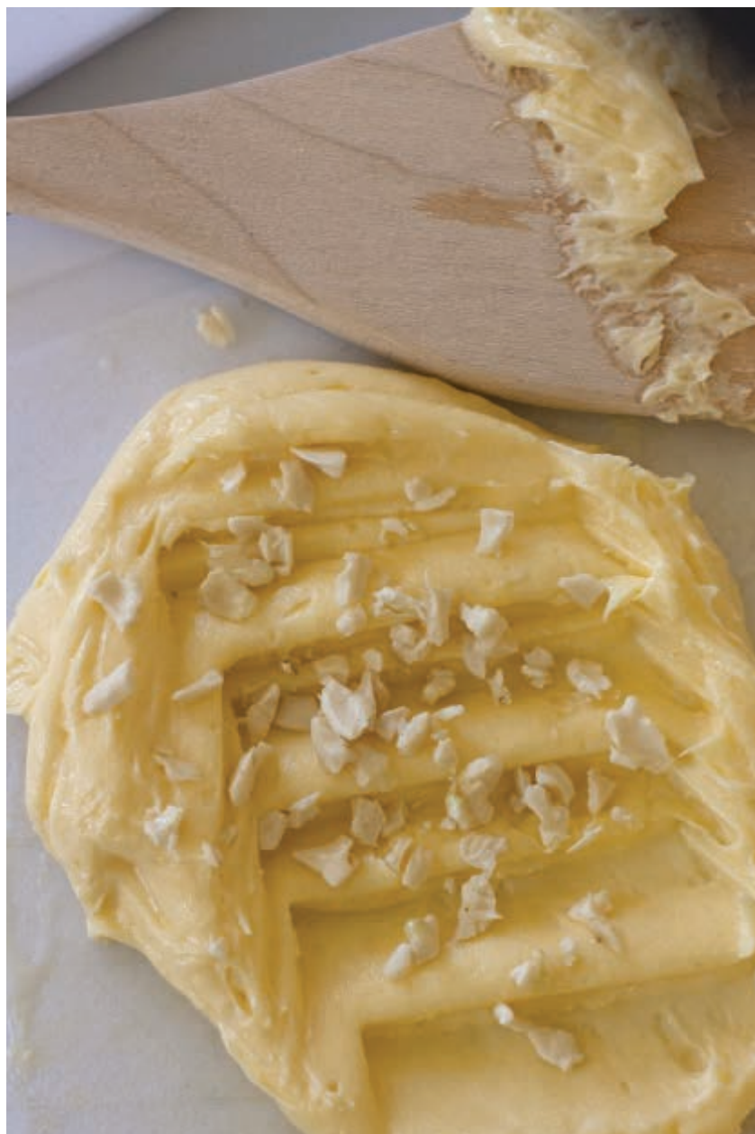
© Camille Orlandini, Les beurres de Thèreval, 2021

Plus d'images sur le projet : https://www.camilleorlandini.com/les-beurres-de-th%C3%A8reval