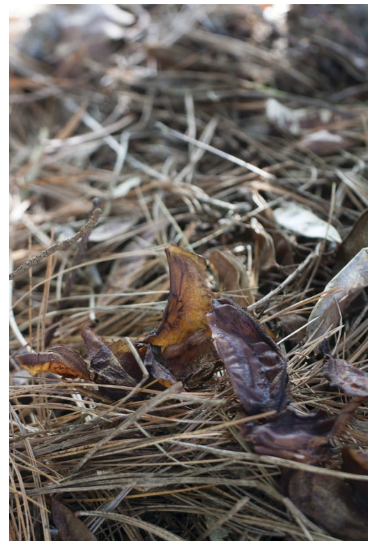
Mons-Hornu, sablé brûlé. Ostende, eau de kiwi fermentée gelée. Verrewinkel, chips de betteraves fermentées.