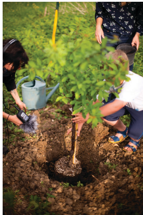
© Michael Garrett - La Maison Forte, le 28 avril 2022